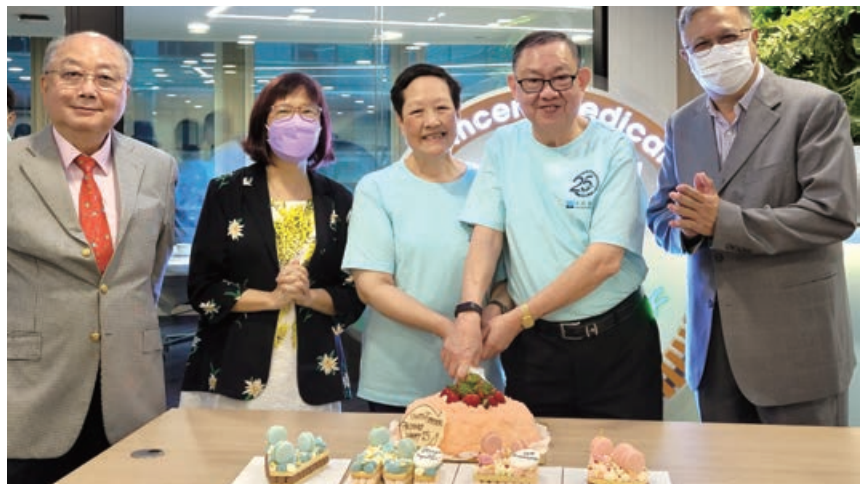
在永勝醫療香港總部的 切餅儀式

於2022年5月23日舉行線上直播啟動禮，為25週年的誌慶活動揭開序幕，同時與本集團在香港、中國內地、日本、美國和歐洲的員工一同分享喜悅。