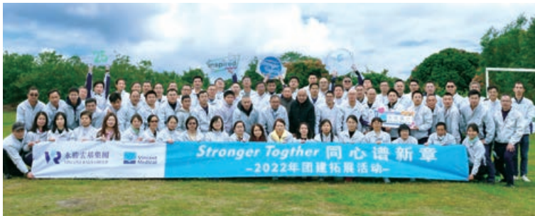
2022年永勝醫療「同心譜新章」 團隊建設活動