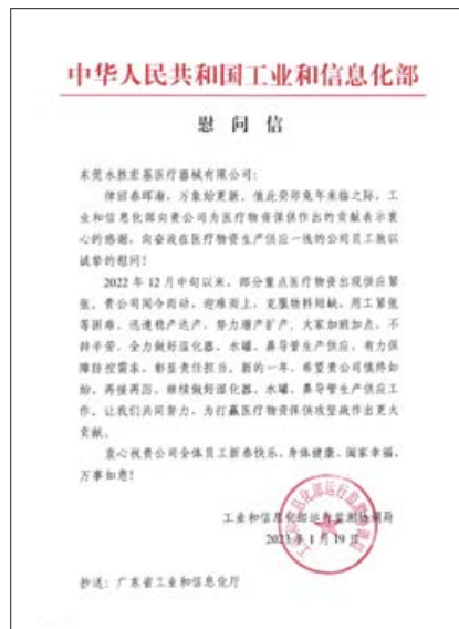
工業和信息化部就本集團的抗疫貢獻發出慰問信

本集團最引以為傲的是持續秉持核心價值「以患者為先」，並通過提供優質的醫療保健，為社會做出貢獻，尤其是在2003年的嚴重急性呼吸系統綜合症(SARS)爆發及最近的2019冠狀病毒病疫情期間。