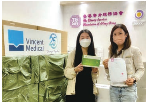
捐贈2019冠狀病毒病自我檢測包

本集團持續致力支持弱勢社群。在2019冠狀病毒病疫情期間，本集團為長者及弱勢社群提供緊急支援，並捐贈20,000套2019冠狀病毒病自我檢測包（價值約200,000港元）。