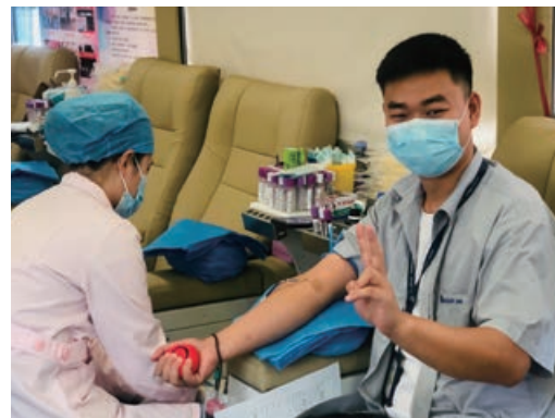
員工參與捐血活動