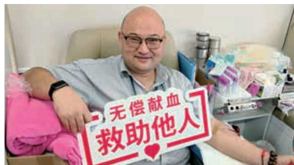
員工參與捐血活動