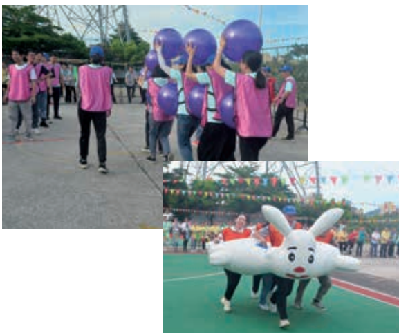
2023年永勝醫療團隊建設活動