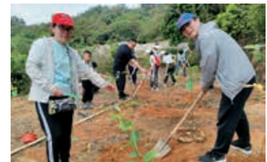
環境保護—綠化活動

本集團最引以為傲的是持續秉持核心價值「以患者為先」及「為更美好人生創造價值」，並通過提供優質的醫療保健，為社會做出貢獻。於報告期，本集團向開平市紅十字會捐贈醫療器械及呼吸類器械（價值約人民幣1,080,000元）。