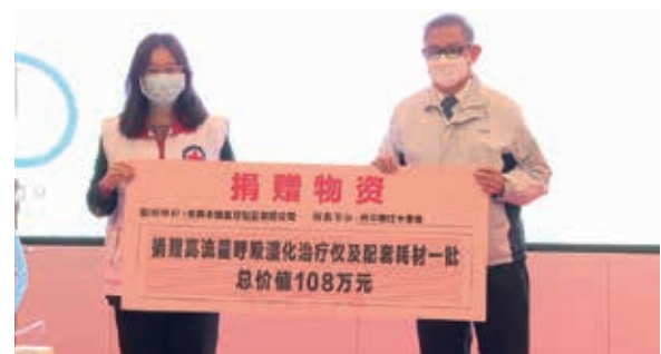
向開平市紅十字會捐贈呼吸類器械

本集團最引以為傲的是持續秉持核心價值「以患者為先」及「為更美好人生創造價值」，並通過提供優質的醫療保健，為社會做出貢獻。於報告期，本集團向開平市紅十字會捐贈醫療器械及呼吸類器械（價值約人民幣1,080,000元）。